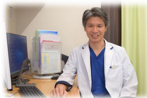
横浜二俣川うめもと泌尿器科クリニック

地域連携パスを活用することで、連携医とがん診療連携拠点病院とが情報交換・共有を行い、安心して質の高い医療を提供・継続する体制を構築することができるようになりました。連携医にとってはがん患者のかかりつけ医としての役割の向上、患者さんにとっては病院での長い待ち時間や通院時間の短縮、ならびにご自身の病状・経過の把握を二人の主治医に診てもらえるといった安心感など、多岐にわたる利点があると考えています。