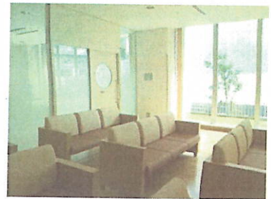
情報センター前のロビー