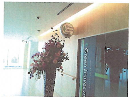
院内のコンビニエンス・ストア 衛生材料も取り扱います。